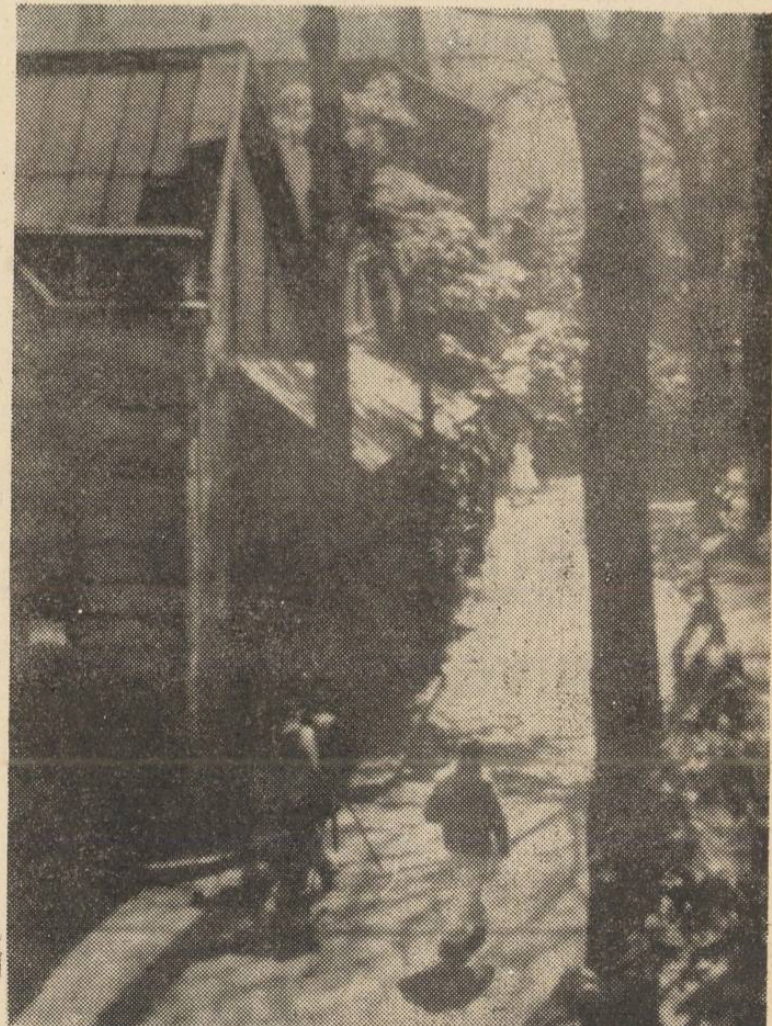
Brâncuși, în Impasse Ronsin. Fotografie făcută în primăvara anului 1947 de către sculptorul George Teodorescu din atelierul său.

Un parc de ateliere, arbori înalți dînd un aspect romantic; intru